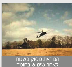
המראת מסוק בשטח לאחר שימוש בחומר

לאור ההנדסה בע"מ מייצגת בישראל את חברת MIDWEST מארה"ב, המייצרת חומרים מדכאי אבק, אותם מוהלים במים ואת התמיסה מרססים על קרקע או על ערימות הגורמות לפיזור אבק ברוח כגון אבקת פחם ואשלג.