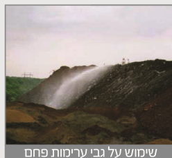
שימוש על גבי ערימות פחם