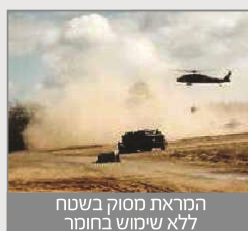
המראת מסוק בשטח ללא שימוש בחומר