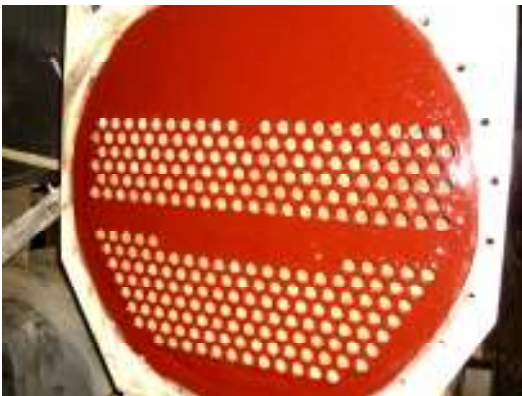
לוח הצינורות מצופה בעובי 4 מ"מ