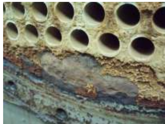
למעלה: המצב לפני הביצוע