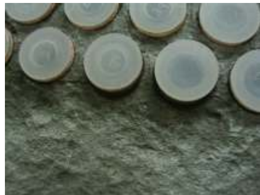
הכנסת פקקים מיוחדים וניקוי אברזיבי

טכנולוגית Plastacor® פותחה ב-1960 ע"י המהנדס ארנסט קרייזלמאייר, ומאז צופו בעולם אלפי מעבים, ומתוכם מאות מעבים ראשיים של תחנות כוח לייצור חשמל. חומרי הציפוי פותחו עבורו בארה"ב במפעל Duromar® אשר מיישם את הטכנולוגיה בארה"ב ובדרום אמריקה. לפלסטוקור העולמית יש מיישמים מוסמכים במספר מדינות בעולם ובישראל הוסמכה לאור הנדסה בע"מ כמיישמת לאחר שביצעה מספר עבודות ביחד עם הצוות הגרמני של פלסטוקור.